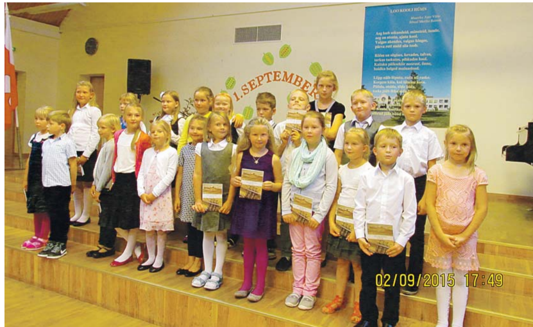
Muusika- ja Kunstikooli astunud.

Infot Jõelähtme Muusika- ja Kunstikooli kohta leiate: www.joelahtmemk.ee .