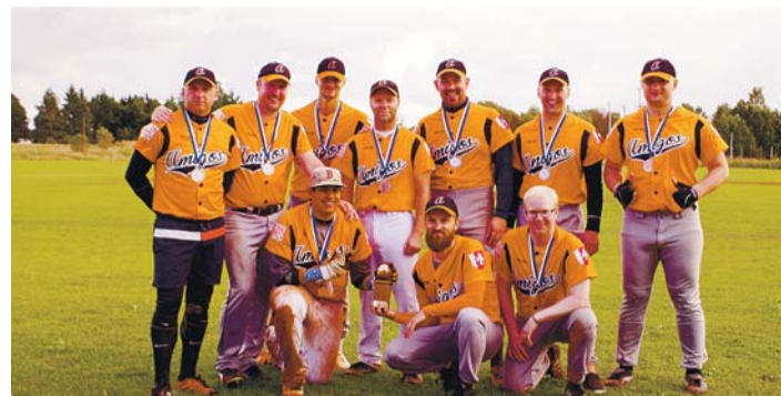
Oli taaskord tore ja sportlik pesapallisuvi, mida ilmataat küll varasemast pisut rohkem šantažeerima kippus – amigostel oli vahepeal juba tõsine plaan hakata kohalikele põllumeestele vihma nõidumise teenust pakkuma, sest millegipärast kippus just nende mängupäevadel Ilmataadi silm märjaks minema.

finaalis võtsid teineteiselt mõõtu põhiturniiri võitja Old Stars ja põhiturniiri neljas, Tallinna Pesapalliklubi. Ei tea, kas oli "kustuvatel tähtedel" suur soov mängu kiiresti lõpetada, et koju Kanteri MM esitusele kaasa elama siirduda või polnud tallinlastel "kõige parem päev" – mäng lõppes viie vooru järel seisul 24:3 Old Starsile.