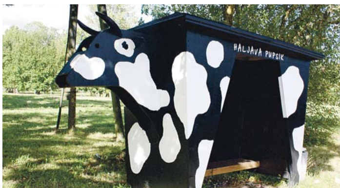
Haljaveski on omanäoline külalaps ja bussi ootekoda.