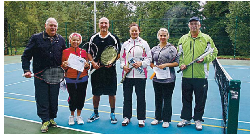
Tennisahooaeg lõppes meeleoluka turniiriga.

Meeldiv spordipäev Irus on jätkuv ja me soovime esimestele tiimidele head taseme säilitamist, teistele usinaid talviseid treeninguid, et kevadel väärikalt võistelda!