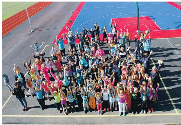
Lust on liikuda, kui sul on nii head sportimise tingimused: uhke spordisaal ja vastvalminud staadion. Vägev!