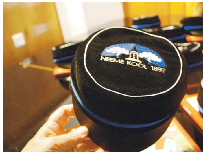
Esmakordselt said Neeme kooli õpilased pähe uued teklid.