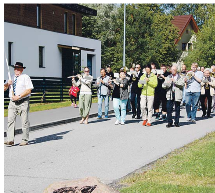
Iru Ämma tunnustamine.