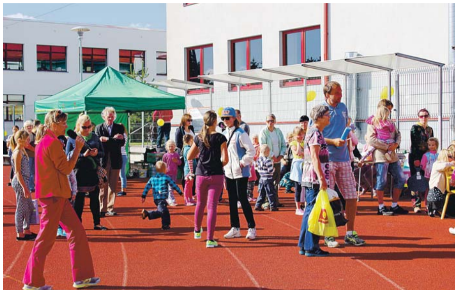
Loo perepäev täies hoos.

Aitäh kõikidele vanadele headele koostööpartneritele: Lunden Catering, Karlskoon, Kikas, Marsimees ja Jõelähtme vald. Täname ka ilmatataiti, kes kinkis Loo rahvale ilusa ilma. Kohutumiseni järgmisel aastal septembrikuu 1. päeval. Korraldaja oli MTÜ Loo koostöös Loo Kultuurikeskusega.